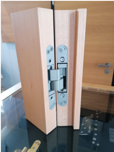
Bildtext: „Pivota DX 35 3-D LT“ heißt die aktuelle und dreidimensional justierbare Version eines kostengünstigen Einsteigermodells im Bereich verdeckt liegender Bänder für stumpf einschlagende Türen.

Das „Pivota DX 35 3-D LT“ liefert Basys auf Wunsch in den Standardoberflächen, wie „Velour vernickelt“, oder in RAL-Farben, wie Schwarz. Als Zubehör erhältlich sind Haltebleche für Futterzargen und Bandaufnahmekästen für Stahlzargen.