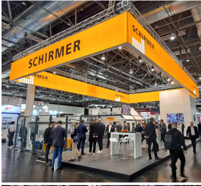
Bildtext: Mehr und qualifizierte Besucher aus den unterschiedlichsten Branchen kamen während der Messe Aluminium vom 8. bis 10. Oktober 2024 auf den Stand der Schirmer Maschinen GmbH.