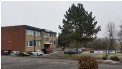
Bildtext 2: Am Vertriebsstandort von D-Beschlag in Herford arbeiten 15 Mitarbeiter.