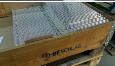
Bildtext 5: Mit längenunabhängigen Stangengriffen und Alu-Griffleisten behauptet sich D-Beschlag als Marktführer in Europa.