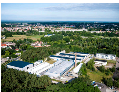
Bildtext 1: Der Produktionsstandort von D-Beschlag in Luckenwalde befindet sich inmitten der „Wiege der Zierbeschläge“. Von oben gut zu erkennen: Alle Hallen sind mit Solaranlagen ausgestattet und nutzen umweltfreundlich das Sonnenlicht zur Energiegewinnung.

Februar 1992 Gründung des Unternehmens D-Beschlag in Luckenwalde 1996 Start der Produktion der ersten längenverstellbaren Kofferrufe aus Stahl, Edelstahl und Aluminium 2004 Investitionsphase einer neuen Produktionshalle (2.800 qm) am Standort Luckenwalde – nach extensiver Bauphase und dreimonatiger Umrüstung bei bester Produktion 2005 Zukauf von Land in Luckenwalde, um den Ausbau des Unternehmens am Standort weitestgehend zu überdecken 2007 Der Vertrieb von D-Beschlag kommt seine Arbeit am neuen Standort in Herford auf D-Beschlag erreicht die zweite Stufe des Wettbewerbs „Grüßer Preis des Mittelstandes“, Bundeswettbewerb und Wettbewerb der Deutscher Preisverleih sprechen dafür ihre Anerkennung aus 2010 Gründung der Abteilung D-Leuchten und Start mit LED-Unterbauleuchten für Küchen sowie LED-Strips 2013 Auf der 2016 in Bad Seibitz besetzt die erste Leuchtenkabinett-Produktion. Die Abteilung D-Leuchten präsentiert erstmals „D-Track“ als eine von mehreren innovativen Lichtlösungen. Bekommt dabei modernste LED-Technologie für die Küchenbeleuchtung. 2014 D-Beschlag bringt die ersten Griffe mit dunkler Oberfläche auf den Markt, angelehnt an Bronze- und Kupferfärbung, und initiiert damit einen Trend für Wohnkulturmerkmale insgesamt.