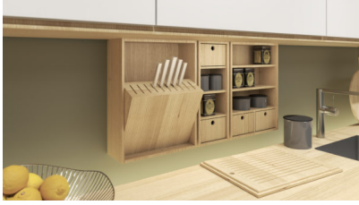
Bildtext 3: Mit „NicheTop“ nimmt das Holzwerk Rockenhausen erstmals auch die Organisation der Küchennische ins Visier.