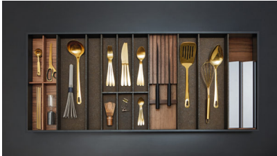
Bildtext 1: Mehr als sechs Bauteile braucht der neue Organisationsbaukasten „EasyLine“ nicht, um fünf Sets zu konfigurieren, die in alle Auszüge und Schubladen passen. „EasyLine“ ist in allen Holzarten und Farben, aber auch in „OrganiQ“ lieferbar.

Ideenreich präsentiert sich das vielfältige Zubehör, mit dem sich die Korpen ausstatten lassen. Dazu gehören zum Beispiel ein klappbarer Messerblock oder Besteckeinsatz für die sichere Aufbewahrung und den blitzschnellen Zugriff, eine Trocknerablage für Sodasprudelflaschen mit Abtropfschale und Deckelhalter, Einsatzböden für Vorratsgefäße oder Gewürzdosen, Schütten in unterschiedlichen Größen und mit Inhaltsmarkierung sowie Vorratsgefäße oder individuelle Beutel aus waschbarem Papier mit praktischem Verschluss, die das immer relevanter werdende Thema unverpackter Lebensmittel bedienen.