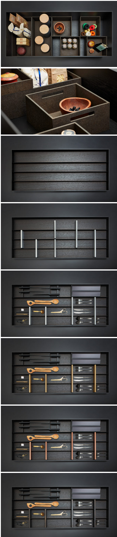
Bildtext 2: Ein Besteckeinsatz mit drei horizontalen Stegen bildet die Basis für „HoLite“. Damit lassen sich Schubkästen durchgängig ausstatten: in Korpusbreiten von 300 bis 1.200 mm. Frei positionierbare Trennstecker erweitern das System. Ein doppelseitiger Messerblock und ein Folienhalter ergänzen „HoLite“ als Zubehör.