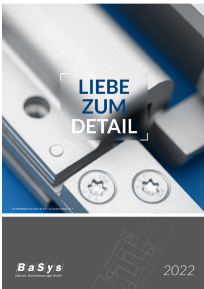
Bildtext: „Liebe zum Detail“ heißt der Kalender 2022 von Basys. Damit lenkt der Baubeschlaghersteller die Aufmerksamkeit auf Band- und Schließblechsysteme für Türen.

Basys liefert mit diesem Kalender einzigartige Impressionen seiner Band- und Schließblechsysteme, zeigt die saubere Verarbeitung „made in Germany“ und demonstriert gleichzeitig das ganze Spektrum möglicher Oberflächen. Per Mail an vertrieb@basys.biz kann er bestellt werden.