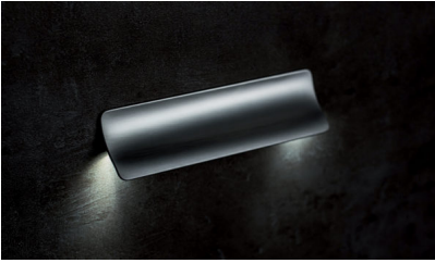
Bildtext 3: Neben Stripes kann beim „Schwinn Light System“ die Beleuchtung auch über lichtleitende Rändelschrauben in den Griff gelangen.