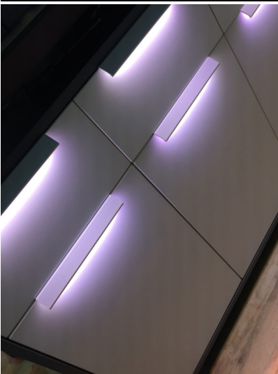
Bildtext 2: Hinter dem „Schwinn Light System“ steht modernste Lichtleittechnik, die im Off-Modus unsichtbar ist. Die längenunabhängigen LED-Stripes werden werksseitig auf die Profile geklebt, können aber auch nachgerüstet werden.