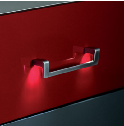
Bildtext 4: Neben Stripes kann beim „Schwinn Light System“ die Beleuchtung auch über lichtleitende Rändelschrauben in den Griff gelangen.