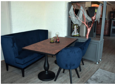
Bildtexte 2 bis 5: Beim Mix aus Kupfer, Schwarz und dunklen Grautönen kam im Restaurant „Zur Alten Post“ in Niedergörsdorf ein Echtmetall auch auf den Tischflächen zum Einsatz. Homapal lieferte dafür das Kupferdekor „401/200 SRM“.