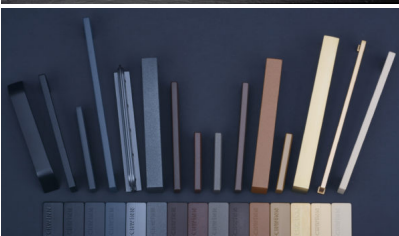
Bildtext 4: Farbvielfalt ist Trumpf bei Schwinn und lässt sich dank moderner Anlagen ausschließlich für die Nasslackierung und Pulverbeschichtung individuell nach Kundenanforderung umsetzen.