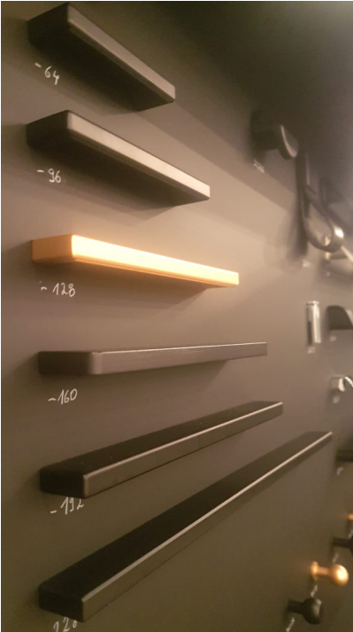
Bildtext 1: Der Leistengriff „22891“ gilt mit seiner reduzierten Formgebung als Klassiker in der Möbelbranche. Die durchdachte Haptik verleiht ein gutes Griffgefühl. Sieben Bohrlochabstände im 32-mm-Raster stehen zur Wahl.