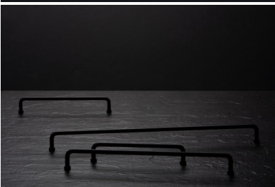
Bildtext 3: Mattschwarz präsentiert sich der Bügelgriff „34034“. Schwinn stellt ihn in fünf Bohrlochabständen aus gebogenem Stahl manuell her. Seine Markenzeichen sind das filigrane Design und die separaten Fußplatten.