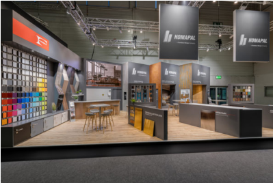
Bildtext 4: Für größtmögliche Gestaltungsfreiheit und den Farb- und Dekorverbund bei Wänden, Decken, Türen und Möbeln bündelt Homapal die Premium-Schichtstoffe aus dem eigenen Hause mit denen der Formica Group. Diese präsentierte auf dem Homapal-Stand die in den Schichtstoff integrierte kabellose und geräteunabhängige Ladetechnologie „Intentek“.