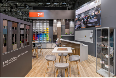
Bildtext 3: Sein Portfolio erweitert hat Homapal bei den Edelmetallen und stellte in Köln seine aktuelle „Trendkollektion 2019“ vor.