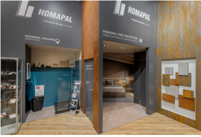
Bildtext 2: Eindrucksvoll präsentierte Homapal zur Interzum erweiterte Brandschutzlösungen und das neue „Aquaris SpaSystem“ im Kontext des Raumkonzeptgedankens.