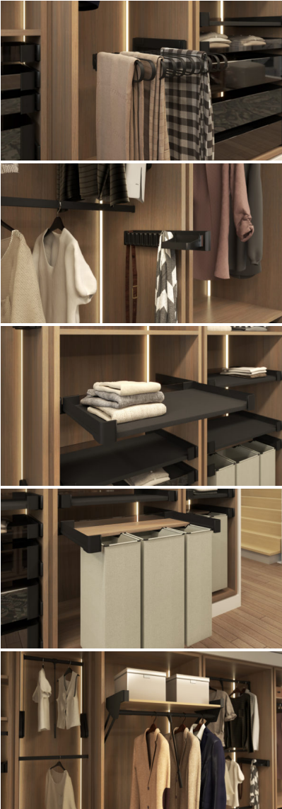
Leyenda 2: Con un elevador de ropa con estante incluido, Kesseböhmer presenta una novedad mundial dentro de su gama "Conero", según su propia información. Foto: Kesseböhmer