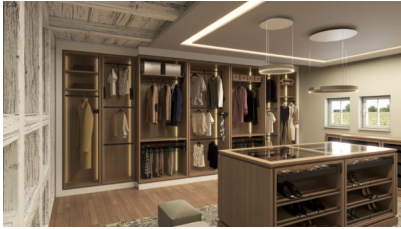
Leyenda 1: Con "Conero", Kesseböhmer ha desarrollado por primera vez una amplia gama de accesorios para la zona de vestidor privada.

que el elevador de ropa sea agradablemente fácil de levantar, incluso cuando está completamente cargado. En caso de que el asa se le escape a la persona usuaria, la cinemática garantiza que el sistema se deslice con seguridad hasta la posición final. A pesar de la gran potencia del sistema, el elevador de ropa también puede moverse armoniosamente cuando está vacío y se bloquea en la posición de apertura. Los elevadores de ropa están amortiguados en ambas direcciones. La barra perchero puede ajustarse en anchura. Están disponibles en diferentes tipologías para anchos de armario de hasta 1.200 mm.