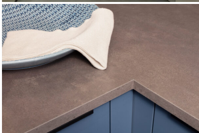
Bildtext 3: Die Impuls-Arbeitsplattenkollektion erfährt unter anderem mit der erdig greigen HPL-Oberfläche „Terragrau“ eine Erweiterung. Es gibt sie in 25 oder 40 mm Dicke.