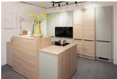
Bildtext 1: Optisch präsentiert sich das Impuls-Sortiment für 2025 geerdet und bodenständig. In dieser Küche mit UV-Lackfronten treffen die neuen Töne „Eiche Summerfield“ und „Salbeigrün“ aufeinander.