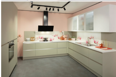
Bildtext 2: Wie ein leichter Sommerwind wirkt das neue „Salbeigrün“ in dieser grifflos gestalteten Küche von Impuls.