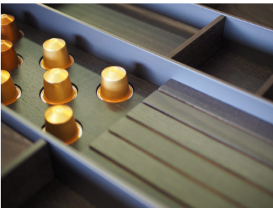
Bildtext 5: Neben dem eigenständigen Design steht beim Holzwerk Rockenhausen die Funktionalität im Vordergrund. Zur Sicam stellt das Unternehmen vielfältige Funktionen vor.