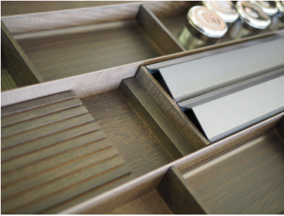
Bildtext 3: Der neue Foliendeckel in titanfarbenem Eloxal harmoniert perfekt mit „Esche Umbra“.