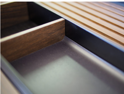
Bildtext 1: Kleine, aber feine Details bestimmen die Inspirationen aus dem Holzwerk Rockenhausen. Der Radius der neuen Besteckschalen fügt sich harmonisch an die Aluminiumstege. Edle Räumereiche wird mit kühlem, schwarz eloxiertem Aluminium kombiniert.

Der Messeauftritt auf der Sicam gehört für das Holzwerk Rockenhausen zum integrativen Bestandteil seines Geschäftsmodells, um Kunden für die Produktentwicklung mit ins Boot zu nehmen und exklusive Lösungen zu generieren. In enger Abstimmung entstehen maßgeschneiderte Ausstattungssysteme, die hohen Anforderungen an Design, Qualität und Funktion gerecht werden wollen.