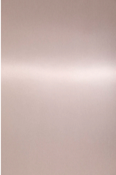
Bildtext 1: Designer haben die Farbverläufe innerhalb der Homapal-Metallkollektion verfeinert. Weiche Zwischentöne, wie „454 – Alu-Strich-matt Rosé Gold“, runden das Gesamtbild ab.