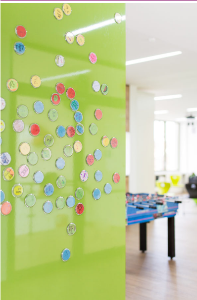
Bildtext 5: Anheften, Schreiben und mehr – die Magnethaftplatten von Homapal sind mit ihren vielfältigen Funktionen prädestiniert für den Einsatz in der Schule, wie im CVG Gymnasium, Kulmbach. Das Dekor „8232 Apfelgrün glänzend“ setzt hier erfrischende Akzente (umgesetzt von Juli architektur | design, Kulmbach).