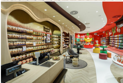
Bildtext 3: Die neue Storck Welt im Centro Oberhausen gilt als aktuelle Referenz für Homapal. „Werther's Original“ präsentiert sich unter anderen mit dem Dekor „471-636 – Alu-Spiegelglanz Lava Goldton“. Realisierung: dan pearlman Markenarchitektur GmbH.