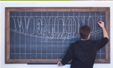
Bildtext 6: Die Möglichkeit, Homapal-Magnethaftplatten mit Kreide zu beschreiben, setzt der Kreidekünstler Marco Kocks auf der Euroshop in Szene.