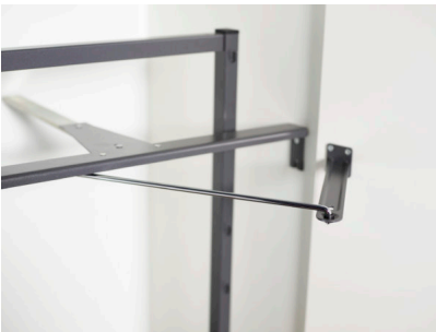
Bildtext 3: Auch den Türanbinder beim „Tandem solo“ hat Kesseböhmer neu gestaltet. Er ist jetzt standardmäßig in verchromtem Runddraht