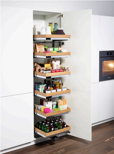
Bildtext 1: Mit den neuen „Arena select“-Tablaren hat Kesseböhmer eine zukunftsweisende Synthese aus Holz und Metall geschaffen. Sie kommen jetzt auch im „Tandem solo“ zum Einsatz.