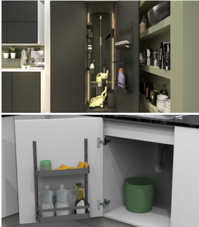
Bildtext 4: Die schlichte und flächige Formensprache von „K-Line“ mündet in einem funktionalen und modularen Kompletprogramm für den Hauswirtschaftsraum.