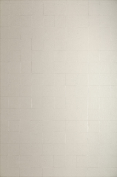
Bildtext 2: „8511_02 – Creme“. „Quadrate“ ist eine von drei neuen Lederoberflächen der Homapal-Kollektion, die sich weich und echt anfühlen.