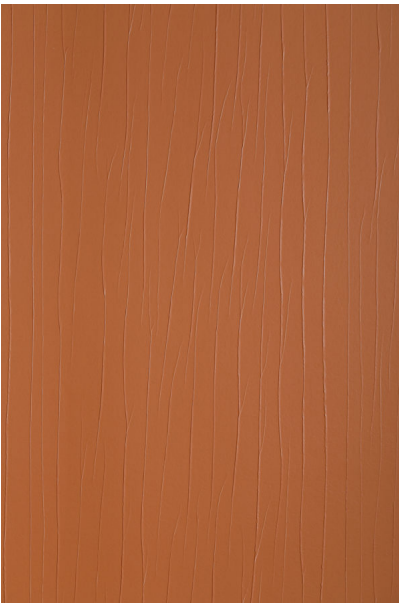
Bildtext 3: Die gesamte Leder-Kollektion bietet Homapal standardmäßig in schwer entflammbarer IMO-Qualität. Wenn es besonders edel aussehen soll, bietet sich „8514_03 – Cognac Lounge Plus“ an.