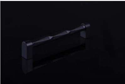
Didascalia 2: L’impugnatura della barra unisce triangoli in rombi.