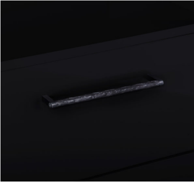
Didascalia 3: Il motivo gofrato rivettato sulle maniglie a barra è stato preso dal settore delle costruzioni in acciaio di ancoraggi in muratura.