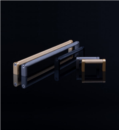
Didascalia 4a: Le barre in alluminio zigrinate ricordano la superficie di una grattugia per noce moscata, ma con bordi morbidi.