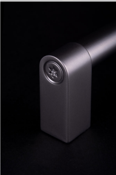
Didascalia 5: Il design industriale in dettaglio su una maniglia sottile.