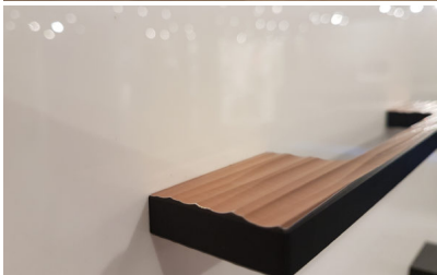
Bildtext 2: Mit echtmetallbeschichteten HPL-Griffen präsentierte D-Beschlag auf der Sicam eine Neuheit, die es auf der Interzum noch nicht gab: Auf einem homogenen schwarzen Kern findet sich eine hauchdünne Metalloberfläche, hier aus Kupfer mit markanter und spürbarer Rillenstruktur.