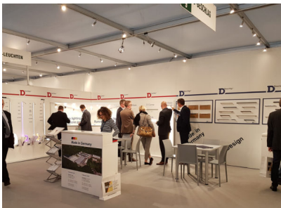
Bildtext 1: Die Sicam 2017 erfüllte für D-Beschlag voll die Erwartungen, die sie im Vorjahr bei der Premiere geschürt hatte. Der Zierbeschlag- und Leuchtenhersteller konnte sich im Kanon einiger Big Player und italienischer Marktbegleiter adäquat präsentieren.