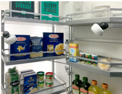
Bildtext 2: Über modular integrierbare Kameras erhält der Nutzer jederzeit und von jedem beliebigen Ort Einsicht in den Vorratsschrank. Kesseböhmer hat spezielle Kamerahalter eigens für den „Tandem“ entwickelt, der sich mit seinem übersichtlichen Innenleben besonders gut als Smart home-Beschlag eignet.