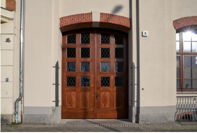
Bildtext 6: Fügt sich harmonisch ins Kulturdenkmal: Von der Tischlerei Arboreus entwickelte zweiflügelige und doppelschlägige Toranlage mit unabhängig voneinander zu öffnendem Ober- und Unterteil.