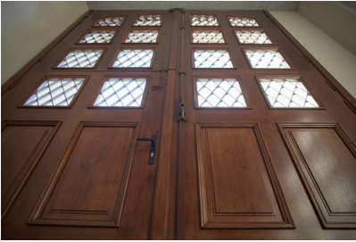
Bildtext 5: Pro Flügel kamen in der ehemaligen Notendruckerei in Leipzig sechs „Objecta“-Rollenbänder „2239/160/56-4S“ mit der Bandaufnahme „STV 135/56/3D“ zum Einsatz.