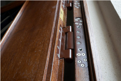
Bildtext 7: Wartungsfreie Schwerlastbänder für eine Tragfähigkeit von 350 Kilogramm pro Paar. Den Farbton Mahagonibraun stimmte BaSys wunschgemäß auf die Tore ab.