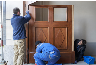
Bildtext 4: Dank 3D-Bandaufnahme lassen sich die Torflügel fein justieren, sowohl in der Höhe als auch seitlich und beim Anpressdruck.