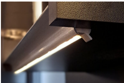
Bildtext 1: „Turnaround“ in der Variante als Unterbodenprofil eines Hängeschrankes in der Oberflächenausführung „Edelstahl gebürstet“. Hier dient das Produkt gleichzeitig als Anschlagprofil. Der Küchennutzer kann bequem dahinter greifen, um die Schranktür zu öffnen.

Die neue Linearbeleuchtung ist in Rastermaßen oder längenindividuell in verschiedenen Oberflächenausführungen erhältlich. Zudem bietet Wessel alle Profilvarianten auch für 19 mm dickes Plattenmaterial. Das Unternehmen stellte das Produkt erstmals zur Sicam 2024 im italienischen Pordenone neben weiteren Lösungen für die Küchen- und Badmöbelindustrie vor.