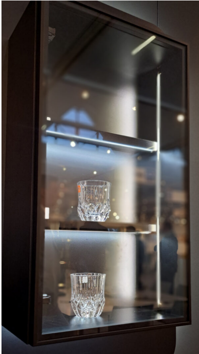
Bildtext 2: Der Hängeschrank mit Glasrahmenfronten ist ein klassisches Anwendungsbeispiel für die neue bewegliche Linearbeleuchtung von Wessel. „Turnaround“ kann hier als Schrankboden- oder Vorderkantenprofil zum Einsatz kommen oder vertikal eingenetet in die Korpusseitenwand.