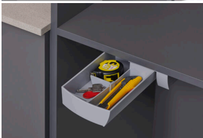
Bildtext 3: Unentbehrlich sind die scheinbar „unbedeutenden“ Helferlein im Besenschrank: ob die leicht zu montierende Schwenkschale „swing“ für Kleinteile ...