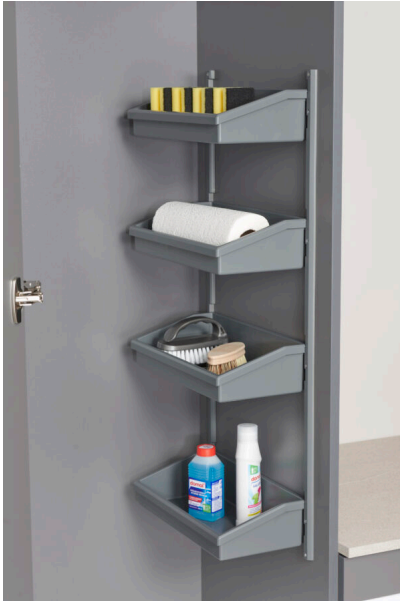
Bildtext 2: Der von Ninka entwickelte Wandhalter eignet sich für die Montage an der Drehtür und schafft schnell Ordnung.