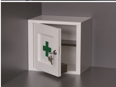
Bildtext 4: Unentbehrlich sind die scheinbar „unbedeutenden“ Helferlein im Besenschrank: ... oder der 1-Hilfe-Kasten „medico“.