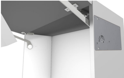
Bildtext 2: „FREEslim“ kann ganz in der Seitenwand verschwinden. Die Integration ist von innen und außen möglich.