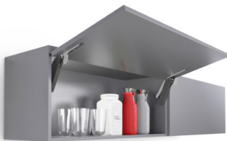
Bildtext 4: Bei den Klappenbeschlägen erweitert „FREEspace forte“ die Range auf 15 Kilogramm bei 600 mm Fronthöhe.