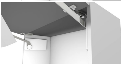
Bildtext 3: Der „FREEslim“-Beschlag lässt sich auch einfach von innen aufschrauben. Das ultraflache Design trägt kaum auf.