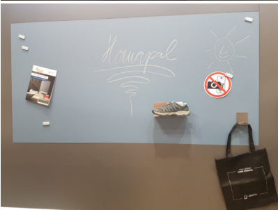
Bildtext 4: Zur EuroShop konzentrierte sich Homapal mit neuer Kollektion einmal mehr auf das, wofür der Name steht: exklusive und zum Teil handgemachte Echtmetallschichtstoffe sowie multifunktionale Magnethaftplatten.