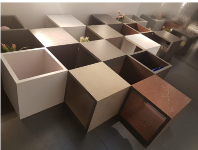
Bildtext 3: Für Homapal als Spezialist für Echtmetalloberflächen und multifunktionale Magnethaftplatten gehört die EuroShop zu den wichtigsten Marktplätzen – bildet doch der Ladenbau eines der Hauptabsatzgebiete für die Homapal-Metallschichtstoffe.