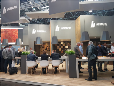
Bildtext 1: „Volles Haus“ auf der EuroShop 2020: Homapal zieht ein positives Fazit. Das Unternehmen führte vor allem am Montag und Dienstag zahlreiche qualitativ gute Gespräche mit Planern und Designern großer Ladenbauketten sowie mit Entscheidern aus dem Messebau.